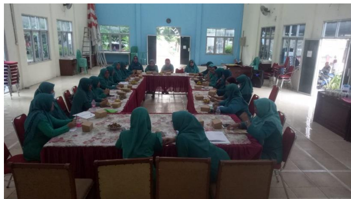
Gambar 2 Kader PKK Tambakaji