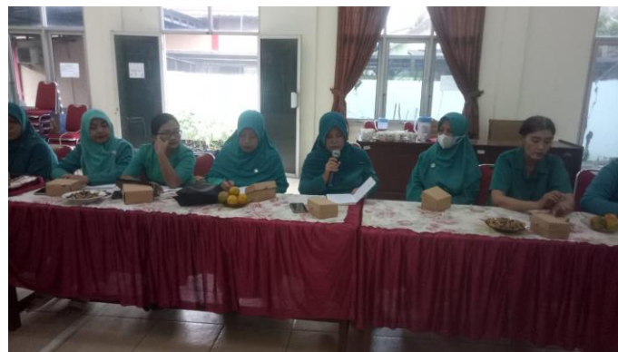
Gambar 3. Kader PKK Tambakaji

Dan dari hasil kegiatan pelatihan ini menunjukkan bahwa sebagian besar peserta yang sebelumnya belum mengenal Google Form dapat memahami dan mengoperasikan fitur dasar aplikasi tersebut setelah mengikuti pelatihan. Berikut adalah beberapa temuan dari hasil evaluasi: