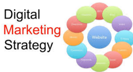
Gambar 2. Strategi Pemasaran Digital

visual dan teks yang menarik untuk menarik perhatian pelanggan termasuk membuat foto produk dan menulis deskripsi produk yang persuasif.