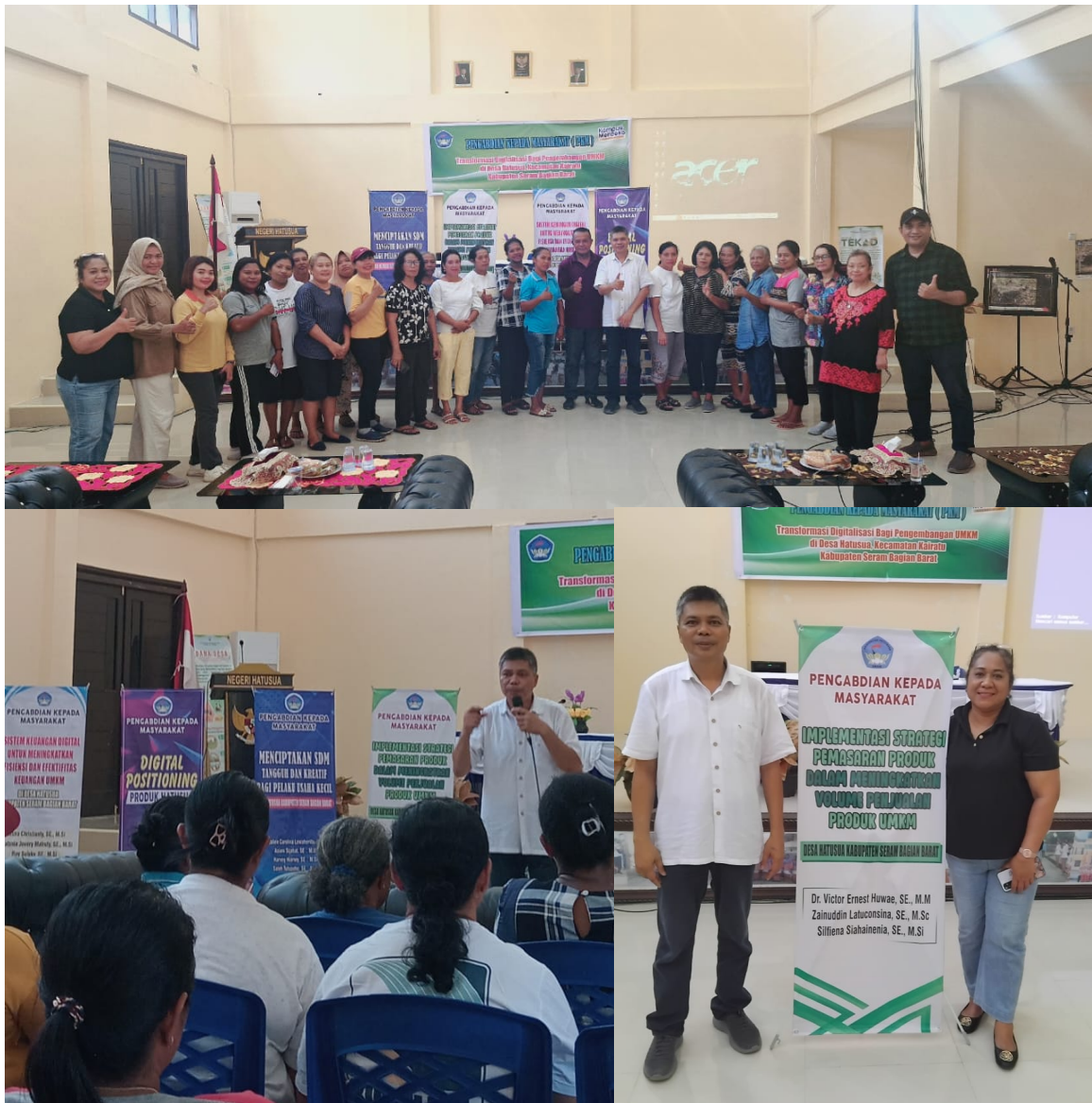
Gambar 5. Kegiatan Pelatihan

Dalam materi terakhir, evaluasi kinerja pemasaran secara keseluruhan adalah fokusnya. Dengan menggunakan indikator seperti jumlah penjualan sebelum dan sesudah kampanye, peserta dididik untuk menilai kampanye pemasaran mereka. Tingkat interaksi dalam media sosial ( like, share, dan komentar ). Komentar pelanggan tentang kualitas produk dan layanan.