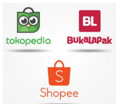
Gambar 4. Pasar Digital

Selain itu, pelatihan ini membahas cara menggunakan pasar online seperti Tokopedia, Shopee, atau Bukalapak untuk menjual barang secara online. Peserta diajarkan bagaimana mendaftar sebagai penjual, mengelola toko online, dan mengoptimalkan deskripsi dan foto produk agar lebih menarik bagi calon pembeli. Untuk membuat produk peserta lebih mudah ditemukan oleh calon pembeli melalui mesin pencari seperti Google, pemateri membahas dasar-dasar SEO. Peserta diajarkan cara melakukan riset pasar sederhana dengan anggaran terbatas, misalnya melalui survei online atau wawancara langsung dengan pembeli. Peserta memperoleh pengetahuan tentang cara menganalisis kekuatan dan kelemahan pesaing di pasar sehingga mereka dapat membuat strategi pemasaran yang lebih efisien.